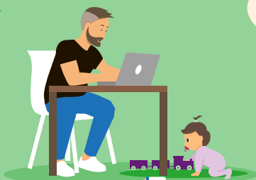
Meer of minder werken